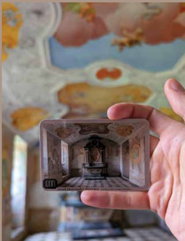
Na fotografiji: grajska kapela.