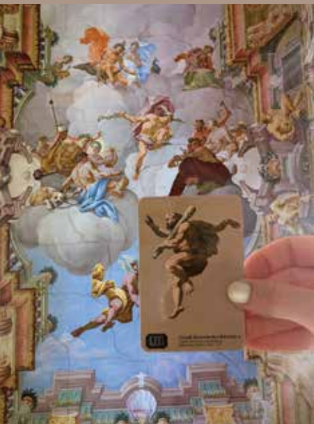
Na fotografiji: Heraklej.

V Grajskem LODNU si lahko kupite tudi magnetek z motivom grajske kapele. Freske, ki so delo F. I. Flurerja, so nastale med 1719 in 1721 in so med vsemi Attemsovimi naročili najmanjše in najmlajše, po vsebini posameznih