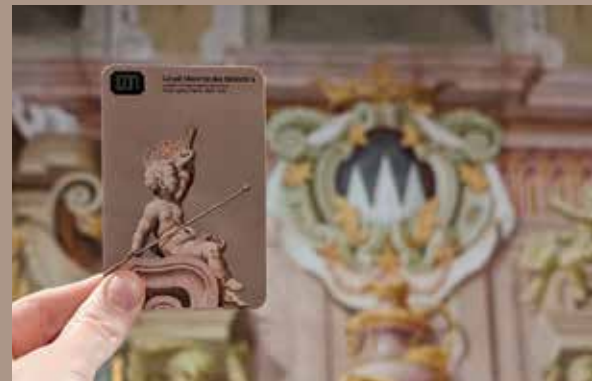
Na fotografiji: simbolizacija slikarstva.