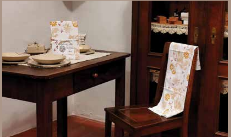
Na fotografiji: kuhinjska krpa z reinterpreteriranim motivom fresk na stopnišču.

Nova kolekcija izdelkov za dom, vključuje kuhinjske krpe, toaletne torbice, nakupovalne torbe in prevleke za blazine, ki so popolne kombinacije umetniške dediščine in sodobne uporabnosti.